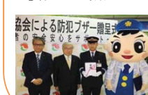
防犯ブザー寄贈式