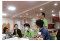
職員への注意喚起