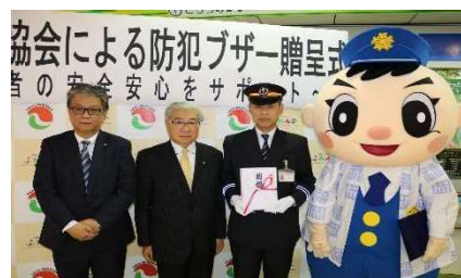
防犯ブザー寄贈式