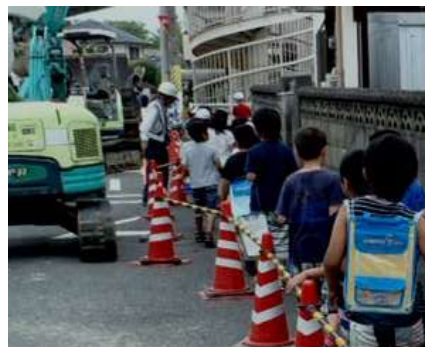
下校時のみまもり